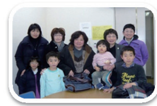
第1回目参加者のみなさん

平成 29 年 7 月 9 日 ( 日 ) 午前 10 : 00 ~ 12 : 00 (9時半開場、中途入退室OKです)