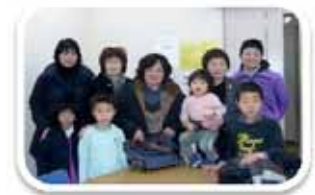
第1回目参加者のみなさん